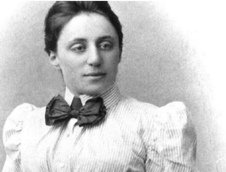
FOTOGRAFÍA: MARIE SOPHIE GERMAIN