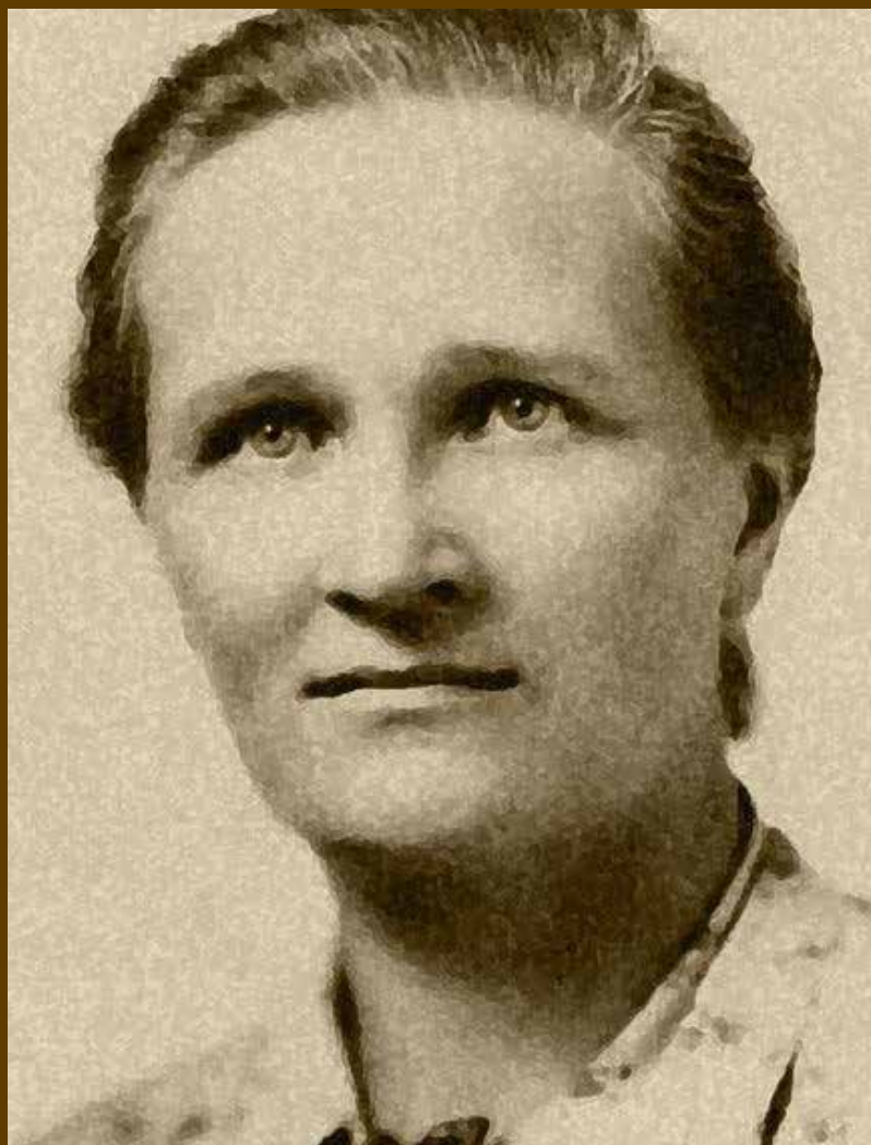
FOTOGRAFÍA: MARIE SOPHIE GERMAIN

Como tantas otras anécdotas, ésta es una historia de lucha contra la adversidad, las reglas e instituciones de la época, pues, al tener el deseo de estudiar en la Escuela Politécnica de París, su familia se opuso y dicha institución no admitía mujeres en aquella época, por lo que tuvo que formarse con apuntes de los alumnos y presentar sus trabajos empleando un seudónimo, Sr. Antoine Auguste LeBlanc, su trabajo final de curso impresionó