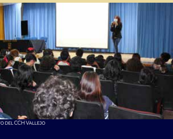
ARCHIVO DEL CCH VALLEJO

Para conocer más esta Aplicación, los protocolos y los servicios que ofrecen, consulta el video de la conferencia que se encuentra en la página de Facebook del plantel.