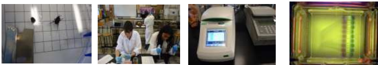
Técnicas moleculares para la extracción del DNA.