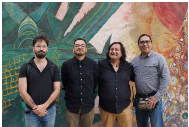
Muralista y personal de patronato

Las fuentes en el proceso creativo de sus obras artísticas fueron algunos libros, cuyos autores fueron David Alfaro Siqueiros, Juan O'Gorman y Diego Rivera. A partir de lo anterior empezaron a tomar medidas de la dimensión de los espacios, se discutió la sección aurea y se crearon planos, documentando todo el proceso.