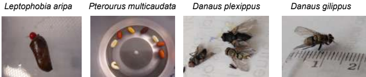
Obtención de los ejemplares de parasitoide.