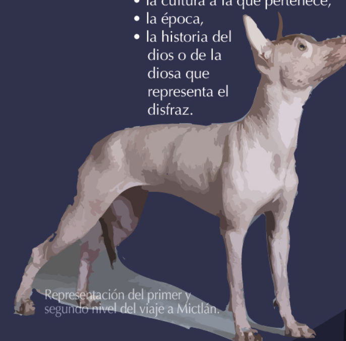
Representación del primer y segundo nivel del viaje a Mictlán.