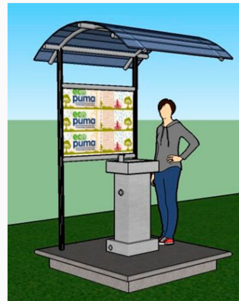
“Proyecto de bebederos nuevos”